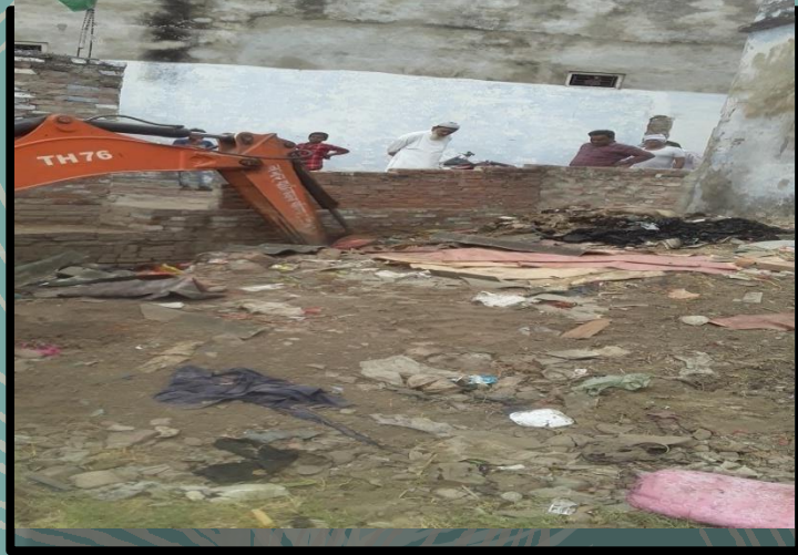
Drain cleaning on daily basis