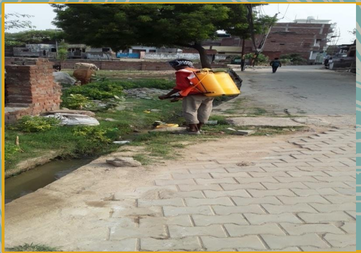
Removing Mosquitoes from sewerage naliya by sprinkling of chemicals