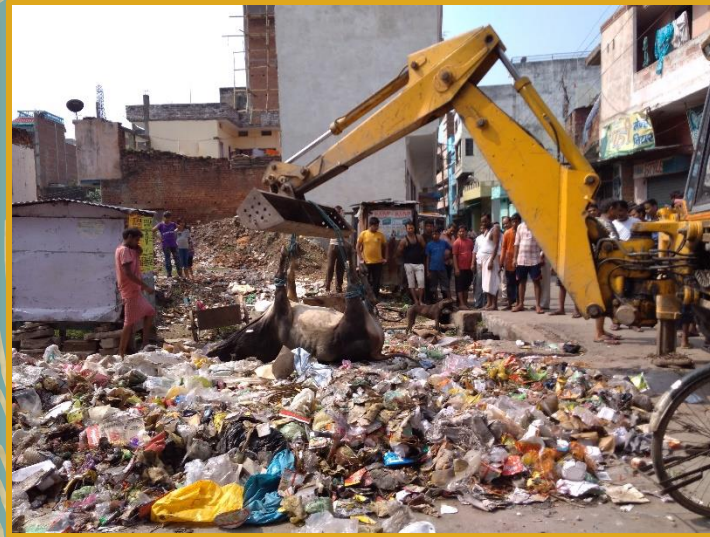
Removing dead Body from Waste Dumping point