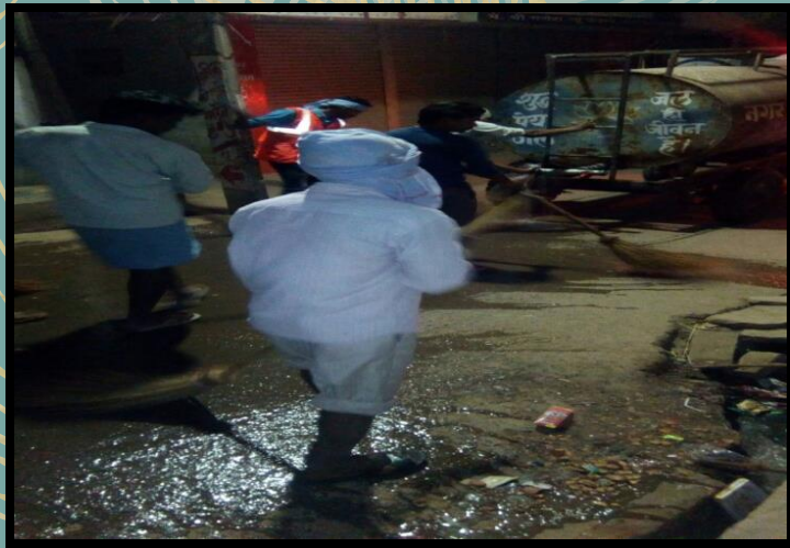
Drain cleaning on daily basis